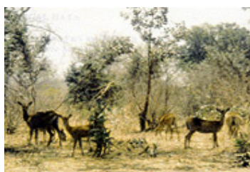
Parc « W » (Niger)