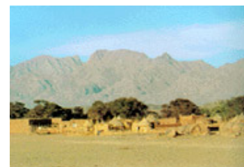
Aïr et Ténéré (Niger)