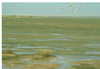
Banc d'Arguin (Mauritanie)