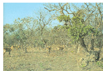
Comoé (Côte d'Ivoire)