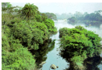
Taï (Côte d'Ivoire)