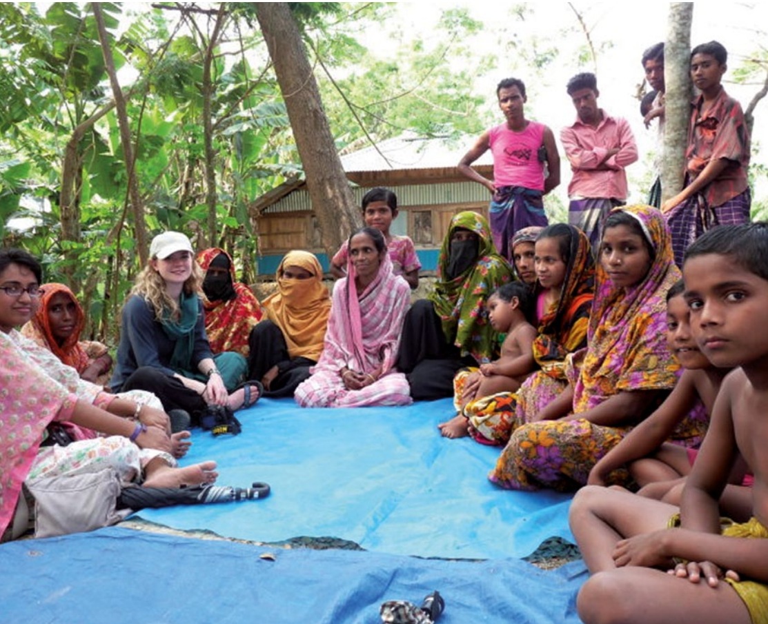
ANÁLISIS DE GRUPOS INTERESADOS EN BANGLADESH: APRENDIENDO A ENTREVISTAR A LAS MUJERES EN LAS COMUNIDADES LOCALES