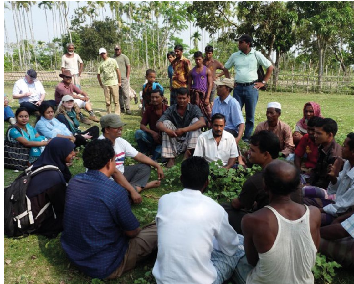
ANÁLISIS DE GRUPOS INTERESADOS EN BANGLADESH: APRENDIENDO A ESTABLECER RELACIONES CON LAS COMUNIDADES LOCALES

Los miembros de la CEC ayudan a desarrollar las capacidades de CEPA alrededor del mundo conduciendo talleres enfocados en tácticas prácticas para involucrar a las comunidades y grupos interesados en las actividades de conservación.