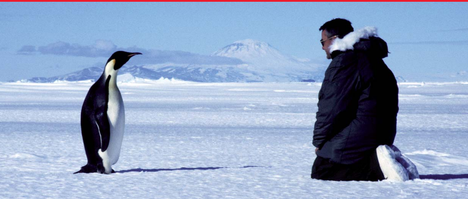
Un manchot empereur Aptenodytes forsteri (Préoccupation mineure) et un homme se rencontrent devant le Mont Discovery (McMurdo Sound, Antarctique).

Il est de plus en plus évident que les changements climatiques vont devenir une des principales causes d'extinction des espèces au 21 ème siècle. Mais comment savoir quelles espèces courent le plus grand risque? L'UICN est en train de mettre au point des outils d'évaluation permettant d'identifier les espèces les plus sensibles ainsi que les régions qui les abritent.