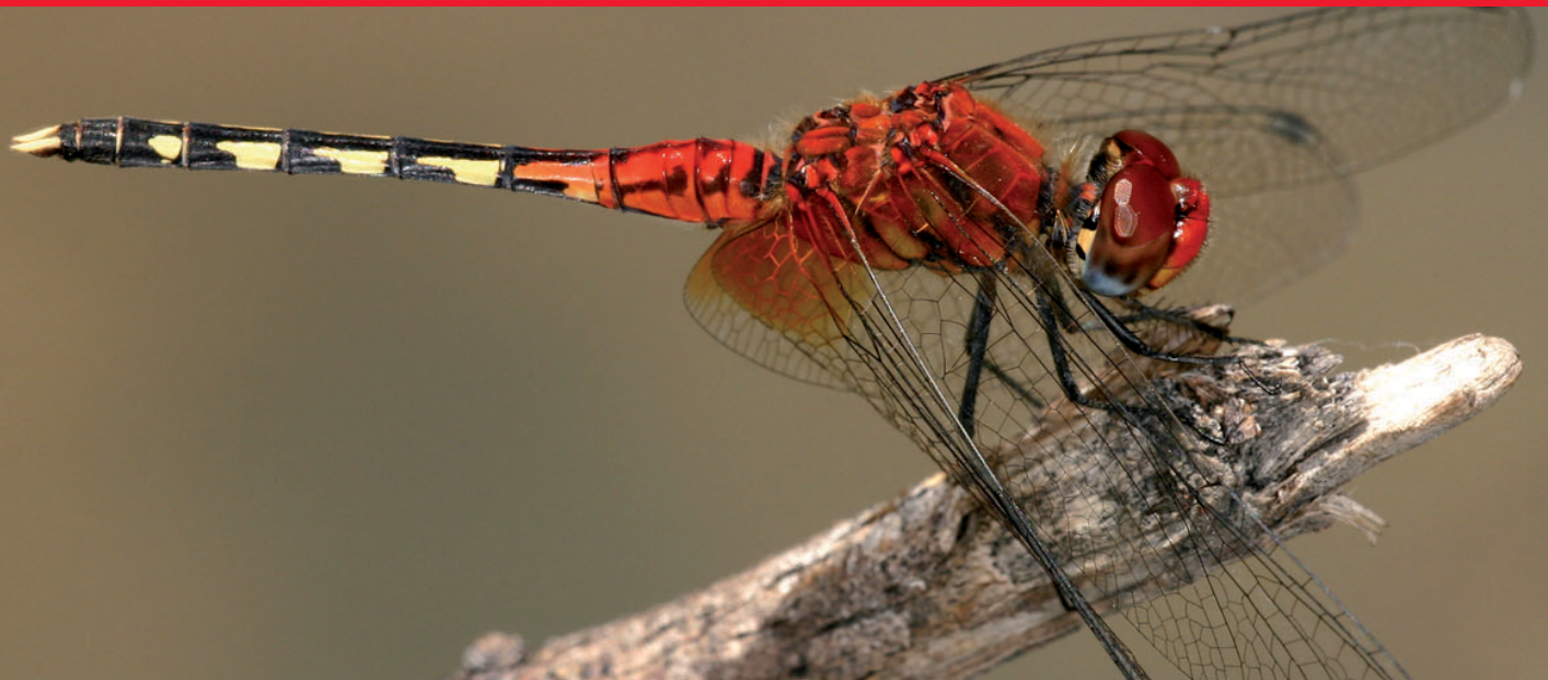
Diplacodes luminans – Préoccupation mineure