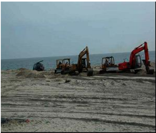
Рисунок 5-3. Оборудование, требуемое для перемещения обезглавленного гладкого кита

Усилие, которое требуется для подъема туши и вытаскивания ее на сушу/берег, зависит от природы местности и размера кита (Рисунок 5-3). С целью усиления трения мы определили следующую градацию поверхностей по степени трения, начиная от самого слабого и заканчивая самым сильным: мокрая плита из камня — базальт, галька, ровный ил, гравий, песок. Если местом для вскрытия является док или вымощенный участок или если место находится вдали от высадки и требует транспортировки, неплохим вариантом для доставки туши в док или на грузовик служит кран или шлюпочная лебедка (подъемник). Для вытаскивания туши на берег лучше использовать гусеничную машину, нежели колесную. Подходящий толстый канат — важное условие для вытаскивания туши выше линии прилива. Целесообразно использовать канаты, цепи или кабели, способные выдержать на разрыв 90 тонн. Будьте предельно осторожны и убедитесь в том, что наблюдатели находятся вне пределов любых зон риска отскакивания разорванных веревок или кабелей.