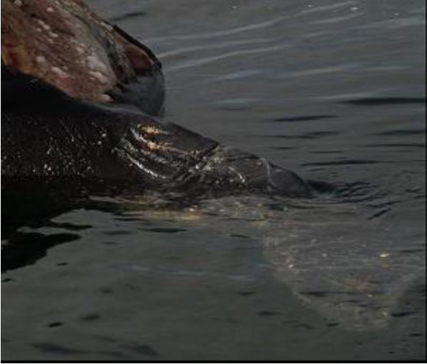
Рисунок 5-1. Отпечаток веревки вокруг головы мертвого крупного кита в море.

наилучшего плана действий. Возможные варианты обследования (буксировка к побережью или осмотр в море) будут зависеть от степени разложения и повреждения от падальщиков. Сильно разложившиеся, сдутые туши при буксировке, скорее всего, развалятся на части и предоставят лишь ограниченный объем информации. Неповрежденные, часто еще раздутые туши с большей вероятностью выдержат трос от буксира и доставку к берегу, обеспечивая лучшие результаты анализа.