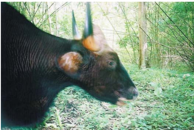
Bò tót (Bos gaurus) tại Vườn quốc gia Yok Đôn: bảo tồn các loài đang bị đe dọa này là một trong những mục tiêu cơ bản trong khuôn khổ dự án hỗ trợ các khu vực cần bảo vệ.

Hệ thống quản lý tài chính cần được điều chỉnh để cho phép phân bổ vốn một cách phù hợp và đầy đủ cho các chi phí thường xuyên để hỗ trợ hoạt động bảo tồn và tạo ra được sự cân bằng giữa phân bổ vốn cho các hạng mục đầu tư và hoạt động thường