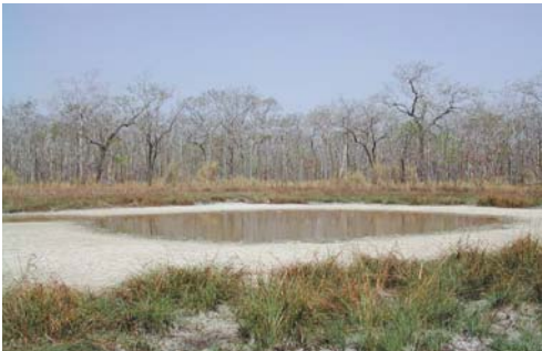
Một trong những vũng nước tự nhiên vào mùa khô tại Vườn quốc gia Yok Đôn.

dẫn đến việc đầu tư bằng ngân sách nhà nước vào khu bảo tồn mâu thuẫn với chức năng bảo tồn thực tế của khu bảo tồn đó.