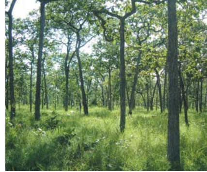
Rừng khộp, Vườn quốc gia Yok Đôn.