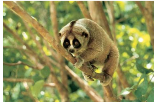
Culi lớn (Nycticebus coucang) loài quý hiếm cấp quốc gia tại Vườn quốc gia Ba Bể và Khu bảo tồn thiên nhiên Na Hang.

Quy trình lập kế hoạch hoạt động đưa ra một công cụ mà qua đó các khu bảo tồn có thể tạo ảnh hưởng lên các quá trình ra quyết định và phân bổ ngân sách của nhà nước. Áp dụng quy trình lập kế hoạch hoạt động cho một khu bảo tồn sẽ thúc đẩy mối liên kết giữa các yêu cầu quản lý của khu vực với các nguồn kinh phí hiện có. Nó cung cấp cơ sở cho việc xác định ưu tiên