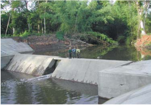
Xây đập cung cấp nước vào mùa khô cho động vật hoang dã tại Vườn quốc gia Yok Đôn.