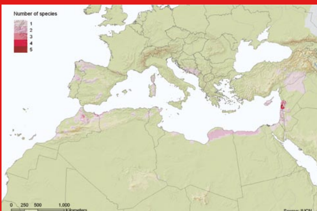
Riqueza de especies de reptiles amenazadas en la cuenca mediterránea.

Dos áreas han sido identificadas por albergar concentraciones importantes de especies amenazadas: una en Líbano, Israel y los Territorios Palestinos, extendiéndose hacia el norte del Sinaí en el noroeste de Egipto, y la otra hacia el norte de Marruecos y Argelia.