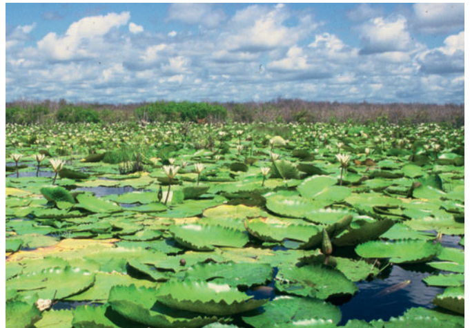
Las especies son piezas fundamentales de la biodiversidad, que nos proporcionan servicios esenciales.

completar la evaluación de todos los reptiles, peces y de grupos seleccionados de plantas e invertebrados. Hasta la fecha solo se ha evaluado una proporción pequeña de las especies del mundo, que indica cómo se encuentra la vida en la Tierra y lo poco que se conoce al respecto.